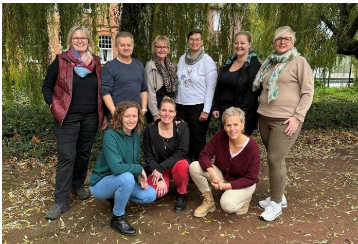
Team der DiAG MAV im Bistum Münster

Wir sehen uns mit euch auf Augenhöhe. Wir mit euch. Wir für euch. Deshalb sagen wir: #gerneperDU