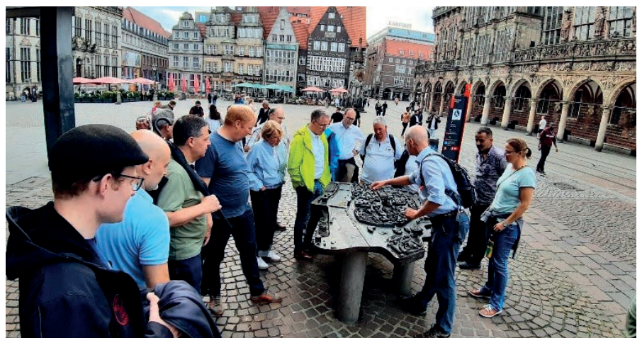
Am Vorabend des Plenums wurden die KODA-Mitglieder im Rahmen einer Führung über die Geschichte Bremens informiert.

Eure / Ihre Mitarbeiterseite in der Regional-KODA Osnabrück/Vechta